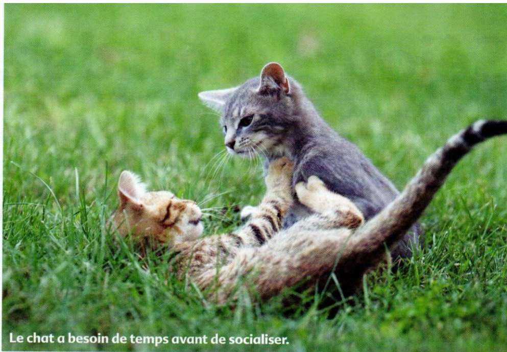
Le chat a besoin de temps avant de socialiser.

Reste enfin la solution des pensions... Si vous faites ce choix, demandez à votre vétérinaire de vous conseiller un établissement ou demandez à vos amis s'ils ne connaissent pas une bonne adresse. Il est également fortement conseillé de visiter les lieux et de bien vous renseigner sur les conditions de garde. Mais pas d'inquiétudes non plus ! Les pensions sont